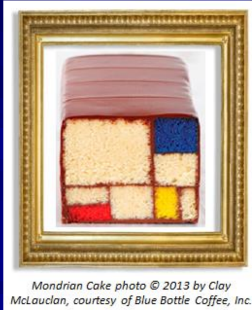
Mondrian Cake